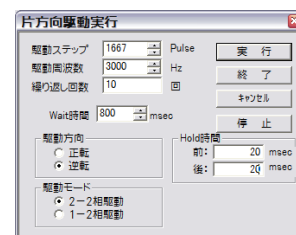
デモソフト表示例