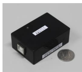
モータードライバーキット