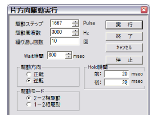
デモソフト表示例