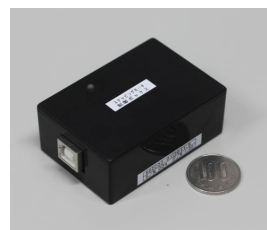
モータードライバーキット